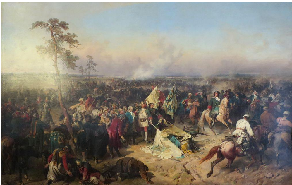
А.Е.Коцебу. Полтавская победа

А). На многофункциональной интерактивной панели с сенсорным экраном изображена картина А.Е.Коцебу «Полтавская победа».